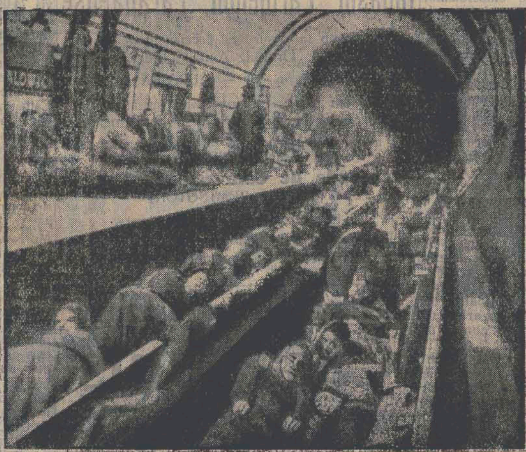
Reproduz-se aqui uma photographia publicada pelo jornal inglez "Daily Mirror". Eis o aspecto que apresentam as estações dos "sub-ways" londrinos, em que a população se abriga, fugindo aos bombardeios alemães, visto que os abrigos anti-aéreos communs são insufficientes.

terras foram lançadas bombas incendiarias e explosivas, entrando em acção diarias comprovando-se a destruição de instalações industriarias. Os aviões alemães estenderam os seus vôos de Londres até a Escossia. Em localidades do sul, centro e norte da In-