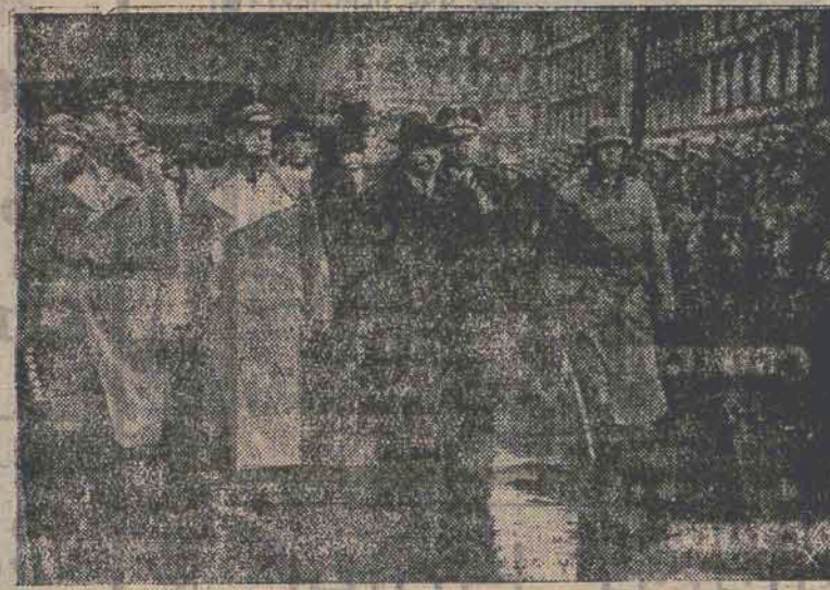
BERLIM RECEBE A VISITA DO COMMISSARIO DO POVO SOVIETICO, SR. MOLOTOW — O cliché mostra aqui a recepção do representante da Rússia na estação de Anhalt, em Berlim.