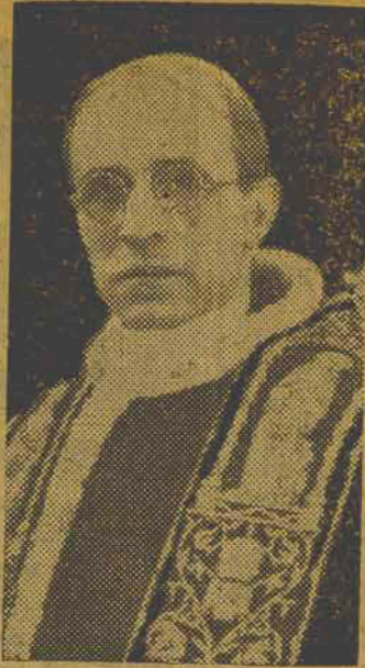
S. S. Papa Pio XII