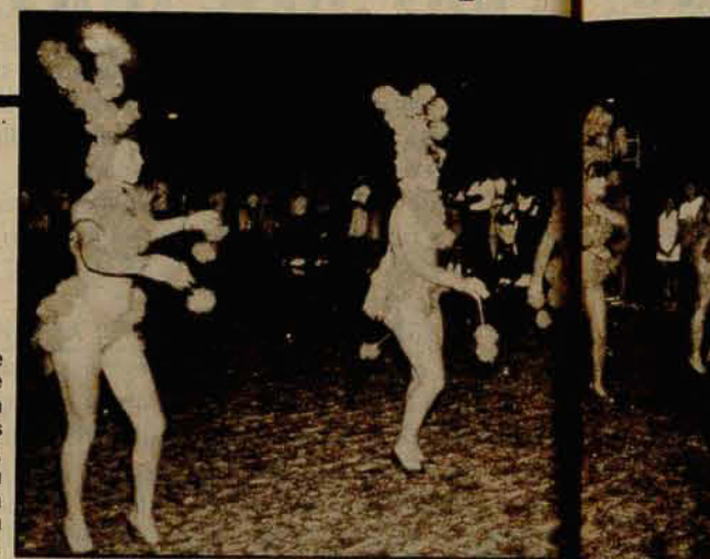
Ala de frente da Escola "Estrelinhas do Mar", que mostrou muita competência na Avenida.