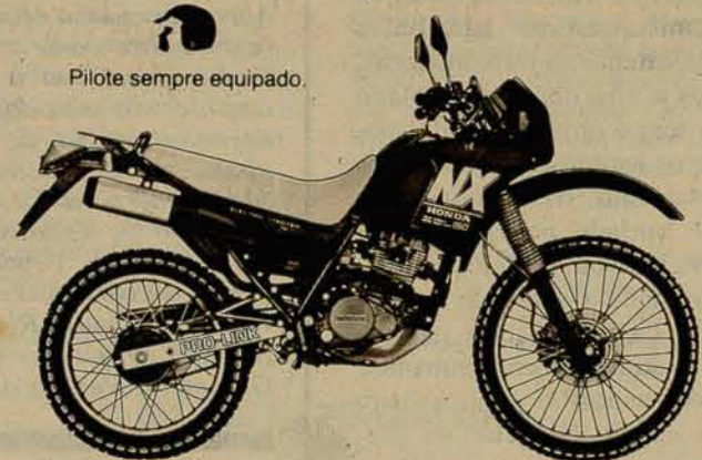
Pilote sempre equipado.

CARDIOPAR Av. São José, 738 - Cajuru Fone: (041) 362-1100 - Ramal 154 80.050 - Curitiba - PR