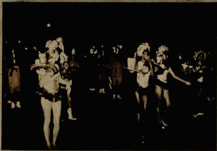
A escola "Estrelinha do Mar", de navegantes abrihantou o desfile