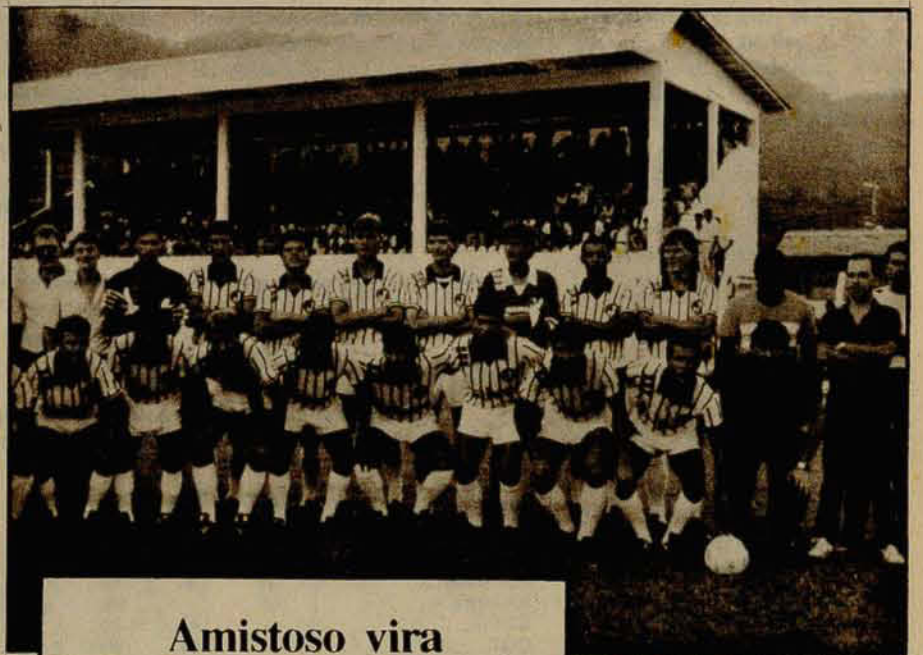
Detalhe do plantel e de alguns diretores do Juventus